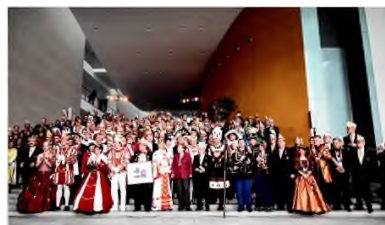
Karnevalempfang im Bundeskanzleramt am 18. Februar 2014